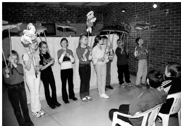
Edukacinio užsiėmimo muziejuje akimirkos.

2003 m. renginių skaičius sumažėjo. Surengta 110 edukacinių renginių, kuriuose dalyvavo 3916 moksleivių. Pagrindinė priežastis – apmokestin-