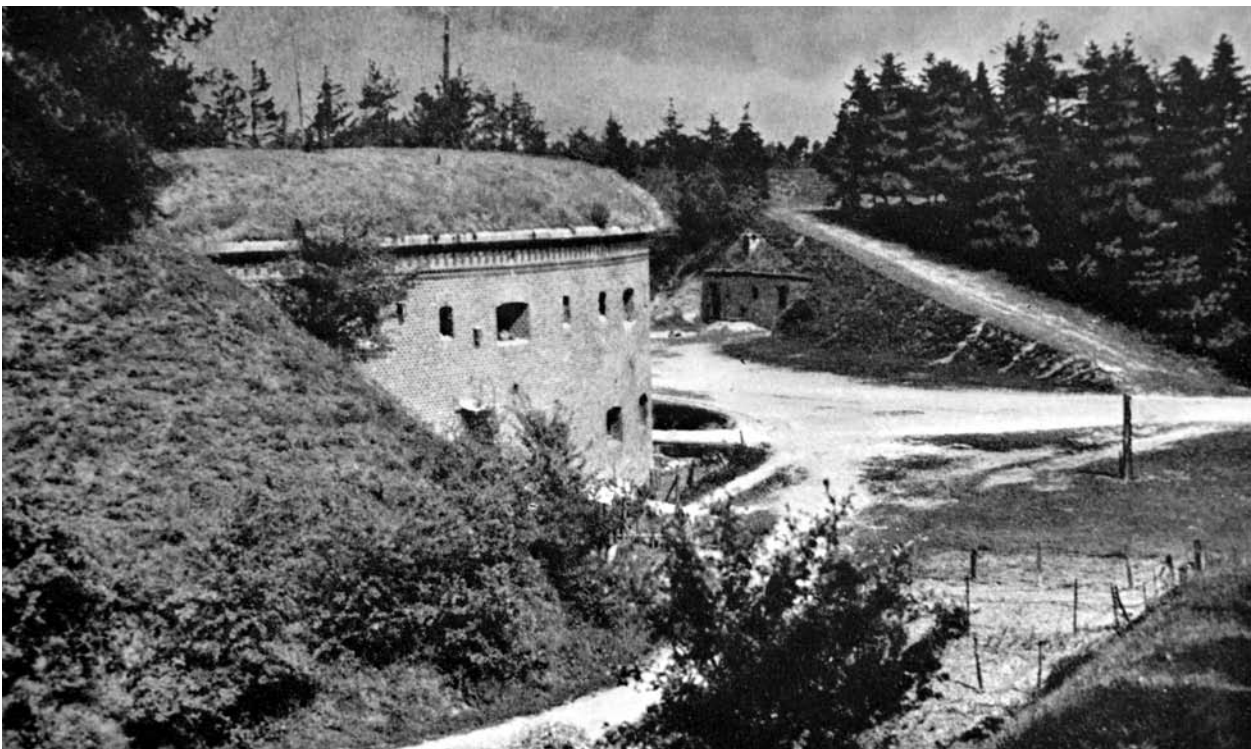
Nerijos forto kiemas, XX a. pradžios atvirukas.

nes sąlygas, banguotumą. Jis buvo gerai matomas. Se-maforo ženklus perskaitydavo Žiemos uoste stovinčių laivų kapitonai. Giedru, skaidriu oru jį pastebėdavo net per 6–7 mylias nuo kranto. Semaforą sudarė stie-bas, ant kurio viena virš kitos buvo pritvirtintos ketu-rios horizontalios judančios signalinės lentelės iš vie-nos ir kitos pusės. Greta stovėję du mažesni stiebai su dideliais skrituliais, padalinti į keturias dalis. Skritulys vaizdavo vėjų rožę. Jo centre pritvirtinta rodyklė rodė vėjo kryptį, o lentelės – vėjo jėgą. Semaforo ženklai buvo matomi iš abiejų pusių. Jo stiebo šiaurinėje pu-sėje pritvirtinta didelė raidė „L“ žymėjo vėjo kryptį ir jėgą link Liepojos. Raide „B“ paženklinta pietinė pusė žymėjo tą patį link Brūsterorto (Sambijos pusiasalis). Apie oro sąlygas semaforo prižiūrėtojas sužinodavo telegrafu iš Liepojos ir Brūsterorto uostų. Atsižvelgda-mas į gautus duomenis, tris kartus per dieną tarnau-tojas reguliuodavo semaforo rodmenis. 26 Geresniam ryšiui su miestu palaikyti prieš Pirmąjį pasaulinį karą į fortą iš miesto buvo nutiestas povandeninis telefo-no kabelis. 1934 m. semaforas naudojosi telefono nu-